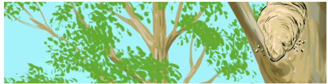
Reserva Natural Pizarro